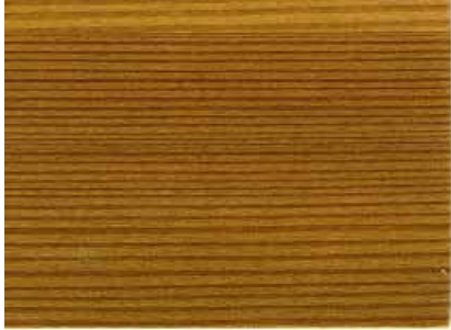
JV-Natur (auf Lärchenholz)